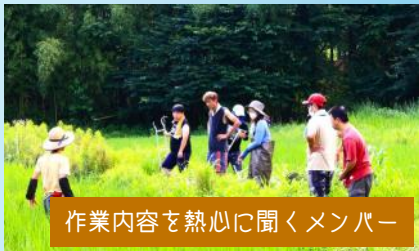
作業内容を熱心に聞くメンバー