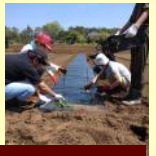
サツマイモの苗を植えています。

畑では、ジャガイモの植え付けも終わり、順調に発芽し、遅霜にあたることなくすくすくと育っています。玉ねぎとニンニクも順調に育ちもうすぐ収穫の時期を迎えます。サツマイモの植え付けも終わりました。落花生の種まきも行います。サツマイモは冬期の稼ぎ頭おさつチップスの原料になるので、失敗すると悲しさ100倍です。