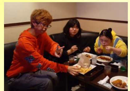
きりの木イベントのワンシーン カラオケ屋さんにて食事を頑張っています。

電話:029-875-8841 メール:kirinoki@npoohzora.org