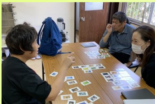
病院受診前の待ち時間。ときどきはこんなお楽しみも(^▽^)/