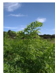
畑のにんじんが スクスクと成長中