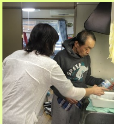
アパートタイプのホームでは、週に1~2回、世話人さんと一緒に居室のお掃除をしています

ひまわりでは、定期的に隣の公園の草取りもしています。ご近所のみなさんに、気持ちよく公園を使ってもらえると嬉しいです。