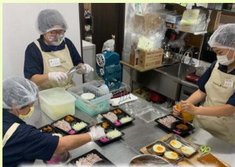
毎朝お弁当づくりに励んでいます